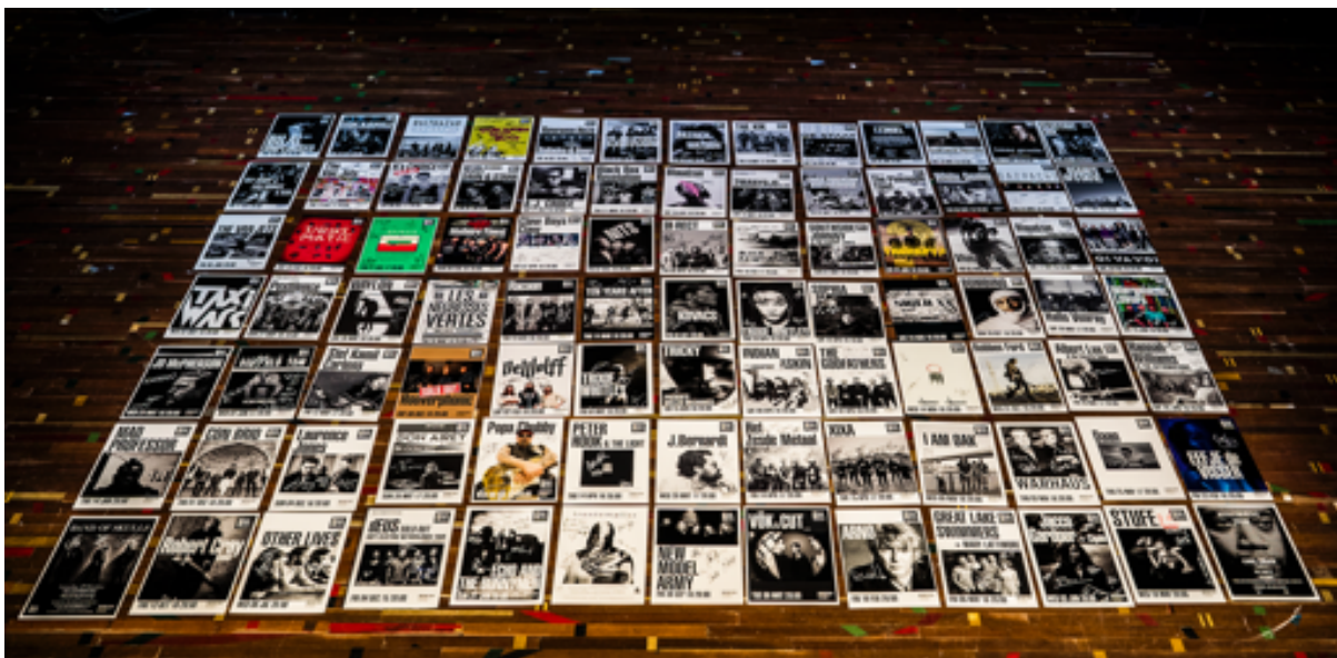
Overzicht van affiches van het rijke aanbod concerten in Muziekgieterij.

De kwaliteit wordt gewaarborgd door met een breed scala aan nationale en internationale bookers en agenten samen te werken. Omdat Muziekgieterij behoort tot een select gezelschap van grote poppodia en als zodanig ook is erkend door de VNPF (Vereniging Nederlandse Poppodia en Festivals) dingt Muziekgieterij mee naar boekingen van grote nationale en internationale artiesten. Door het bewaken van het profiel als volwaardig poppodium resulteert dat in een volle concertagenda waar een breed en gevarieerd publiek kaarten voor wil kopen. Vanwege de kwaliteit die Muziekgieterij levert op het gebied van concerten, zowel voor de artiest als de bezoeker, zal het aanbod de komende tijd alleen maar groeien. De raad van toezicht en directie zoeken constant naar de juiste afstemming hierin zodat de aansluiting met het aanbod en de organisatie in balans blijft. Voor 2022 en een gedeelte van 2023 zal de organisatie, zoals dat ook is aangegeven in het beleidsplan, op sterkte moeten zijn om op een duurzame wijze een volwaardig poppodium te blijven.