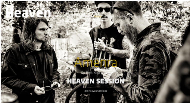
De Belgische populaire band Amenra in een MHeaven sessie op Best Kept Secret Festival.

Een voorbeeld van innovatie binnen Muziekgieterij is het project MHeaven. Een project waarbij Muziekgieterij samen met het blad Heaven relevante, vernieuwende opkomende bands en acts een digitaal podium biedt. Muziekgieterij werkt hierbij samen met het popblad Heaven en onder andere het festival "Best Kept Secret". Muziekgieterij maakt (met de ervaringen opgedaan tijdens de coronapandemie) digitale opnames van de acts. Op korte termijn wordt dit digitale materiaal ingezet ter promotie van het popblad, ter promotie van het festival, maar ook ter promotie van Muziekgieterij. Op de langere termijn bouwt Muziekgieterij samen met Heaven aan een digitaal multimedia platform dat uiteindelijk een extra USP wordt voor het boeken van vernieuwende relevante bands/acts voor Muziekgieterij. Hiermee wordt een stop in Maastricht tijdens een tour extra interessant. Dergelijke projecten doen recht aan de infrastructuur van Muziekgieterij en ze bouwen mee aan het versterken en verstevigen van de popcultuur in onze regio.